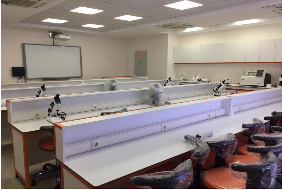
Şekil 2. Optisyenlik Laboratuvarı