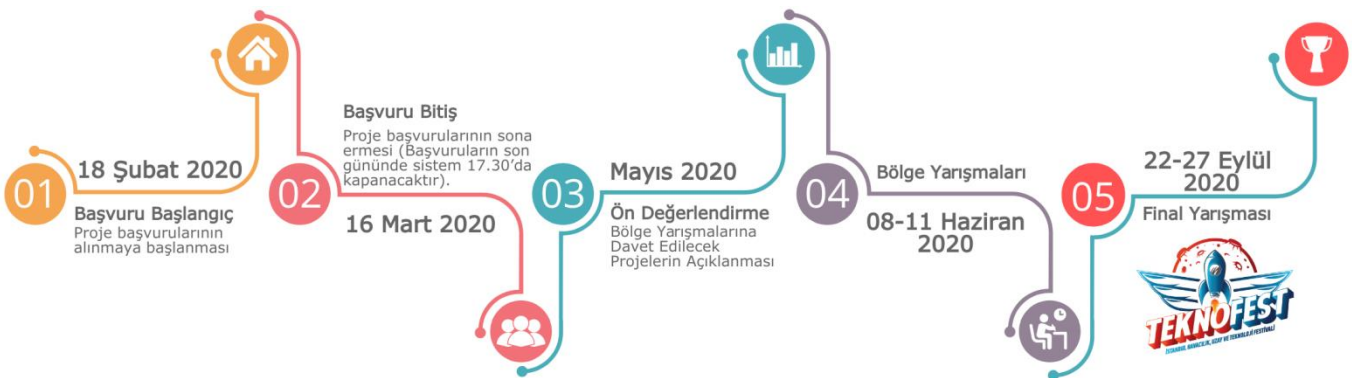
Şekil 3: Yarışma Takvimi

5.1 Yarışma için yılda bir kez başvuru alınır. Yarışma kapsamında önce 12 bölgede bölge sergisi düzenlenir, sonrasında final sergisi yapılır. Aşağıdaki Şekil 3'de süreç özetlenmiştir.