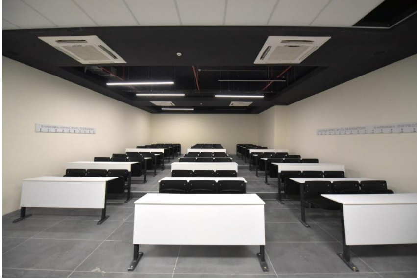
Şekil 1. Derslik

Yüksekokulumuzun hâlihazırda kendine ait bir binası yoktur. Rektörlük Merkezi Derslik Binasında Yüksekokulumuza tahsis edilen iki derslik ve beş çalışma ofisi ile eğitim öğretime devam etmektedir.