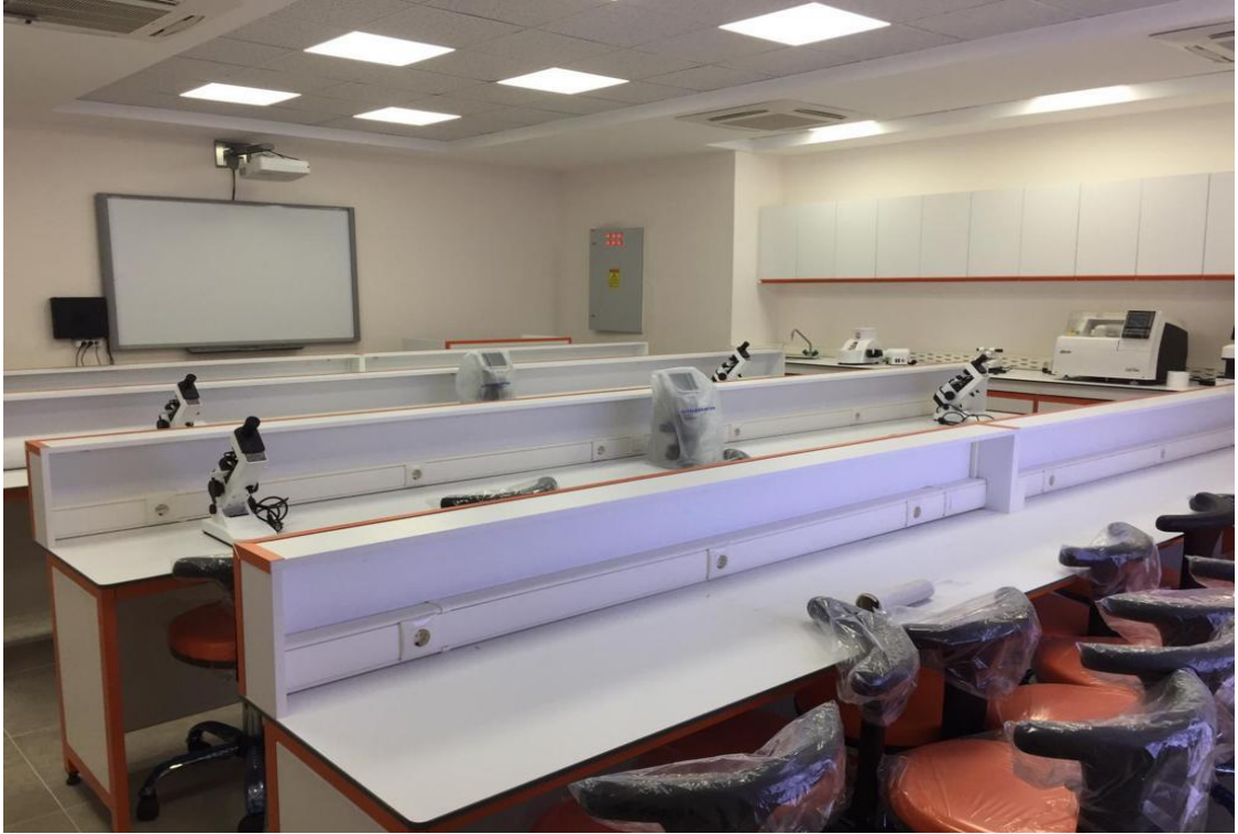
Şekil 2. Optisyenlik Laboratuvarı